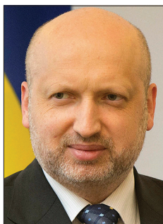
Виконував обов'язків Президента України Олександр Валентинович Турчинов . 2014р.